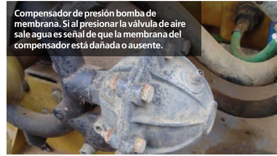
Compensador de presión bomba de membrana. Si al presionar la válvula de aire sale agua es señal de que la membrana del compensador está dañada o ausente.

El regulador de presión debe ser aflojado al término de la aplicación con el propósito de evitar que el resorte modifique su tensión y su longitud, que impide variar la presión de trabajo. En general, los aplicadores en cambio sólo desconectan el eje toma de fuerza al concluir las aplicaciones. Cuando el resorte modifica su longitud el aplicador tiende a introducir golillas, pernos u otros en el resorte a fin de modificar las presiones de trabajo.