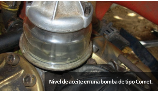
Nivel de aceite en una bomba de tipo Comet.