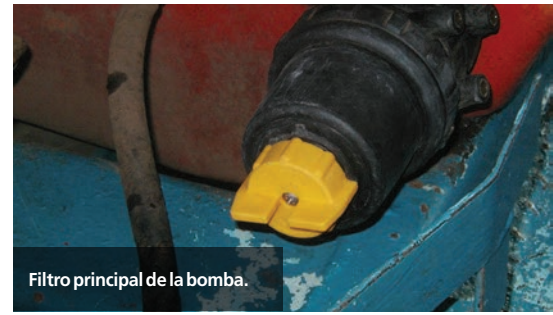
Filtro principal de la bomba.

encuentre libre de impurezas creando la falsa sensación de limpieza. Un filtro dañado o roto debe ser inmediatamente reemplazado a fin de evitar daños graves tanto a válvulas de la bomba como al comando del equipo.