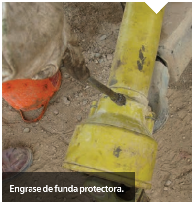
Engrase de funda protectora.