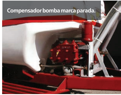
Compensador bomba marca parada.

Si la membrana del compensador está perforada o ausente, el equipo presentará oscilaciones indeseables que se traducen en una irregular aplicación, lo que afectará