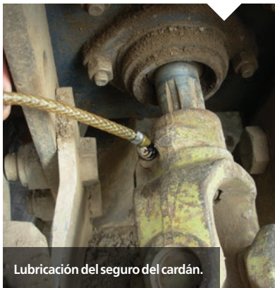
Lubricación del seguro del cardán.