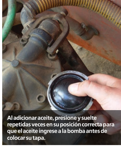
Al adicionar aceite, presione y suelte repetidas veces en su posición correcta para que el aceite ingrese a la bomba antes de colocar su tapa.