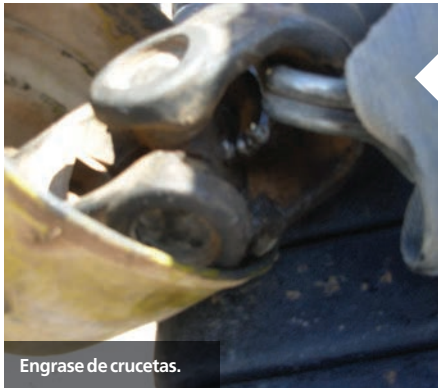
Engrase de crucetas.